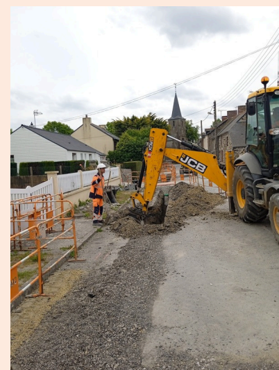
Rue de l'Île Verte