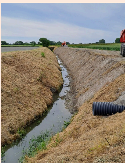
Chemin des Clossets

Un grand merci aux bénédictins, artisans, commerçants, agriculteurs, hébergeurs pour leur patience et compréhension !