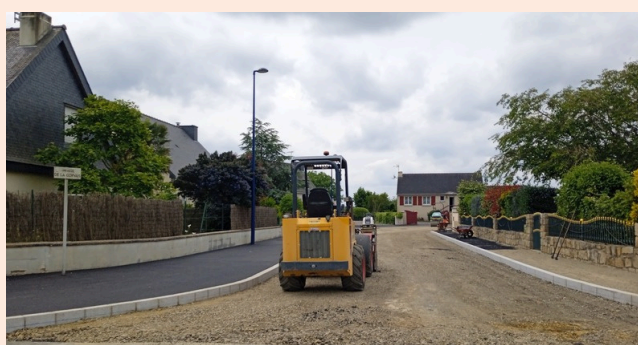
Impasse de la Corvais